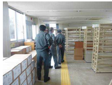
建物の被害状況や支援内容などを確認しながら、館内を視察しました