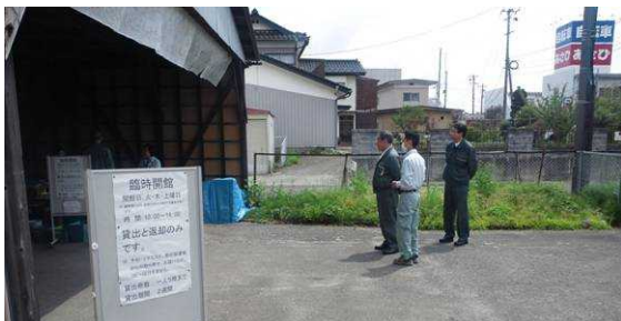
実際に臨時開館している様子を拝見することができました